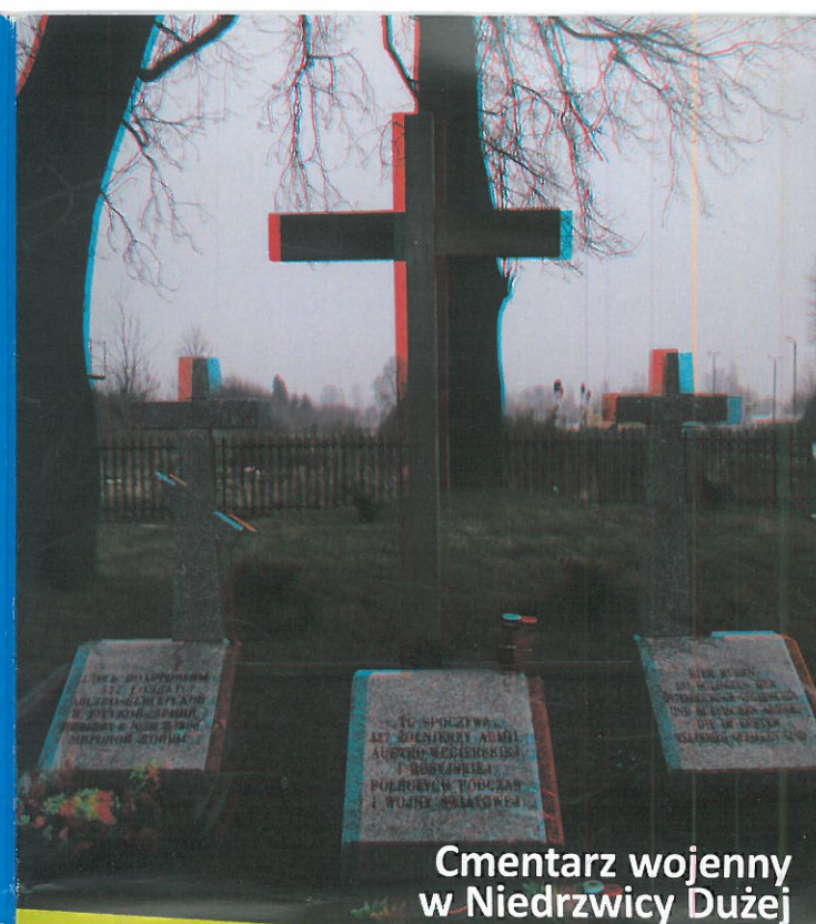
Cmentarz wojenny w Niedrzwicy Dużej