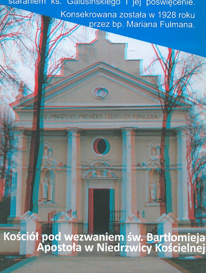
Kościół pod wezwaniem św. Bartłomieja Apostoła w Niedrzwicy Kościelnej